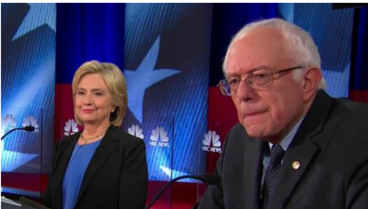
L'ancienne secrétaire d'État Hillary Clinton et le sénateur Bernie Sanders.