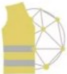
Gilets Jaunes Coordination