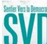
Sentier Vers la Démocratie