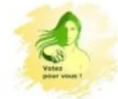
Votez Pour Vous