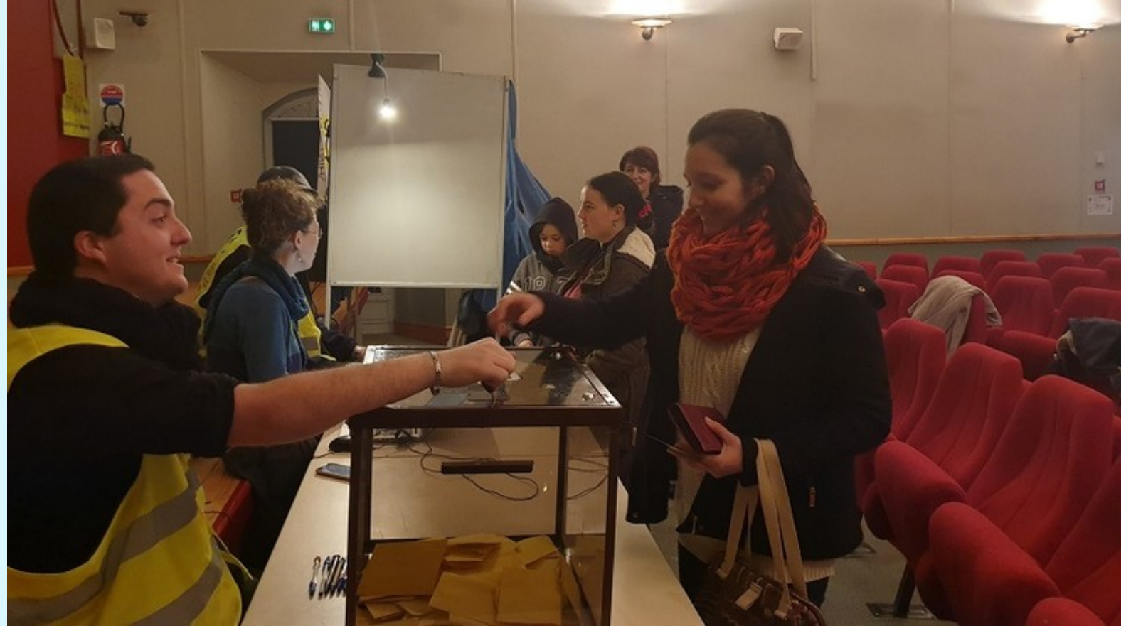
Les Saint-Affricains s'adonnant au RIC.

Si l'idée a germé dans leur esprit en début d'année, après avoir assisté à une conférence sur le sujet, l'organisation du vote à proprement parler n'a commencé qu'en juin. C'est un vrai parcours du combattant auquel les Gilets jaunes ont alors été confrontés pour mener à bien le projet ; du travail pédagogique à faire auprès de la population pour expliquer en quoi consiste un RIC, aux tractations avec le maire pour obtenir les listes électorales ainsi que du matériel, en passant par la distribution de 3 500 bulletins, et surtout l'élaboration des propositions par les habitants.