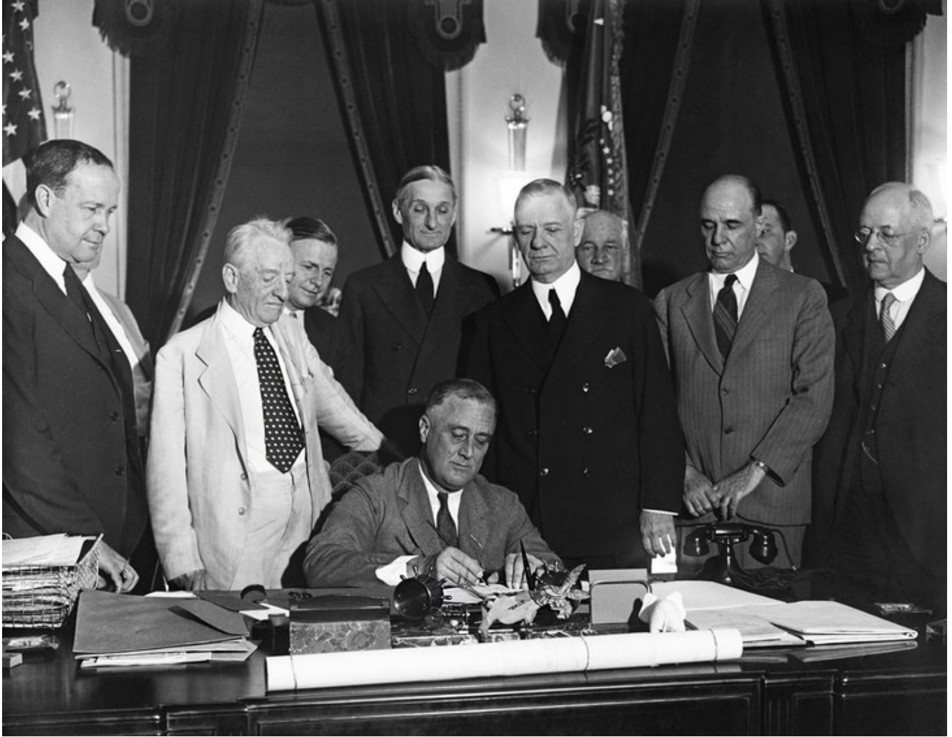
Franklin Roosevelt signe le Glass-Steagall-Act le 16 juin 1933 : à partir de cette date, c'est la fin des crises financières ! (et le métier de banquier de dépôts devient ennuyeux et mal payé).