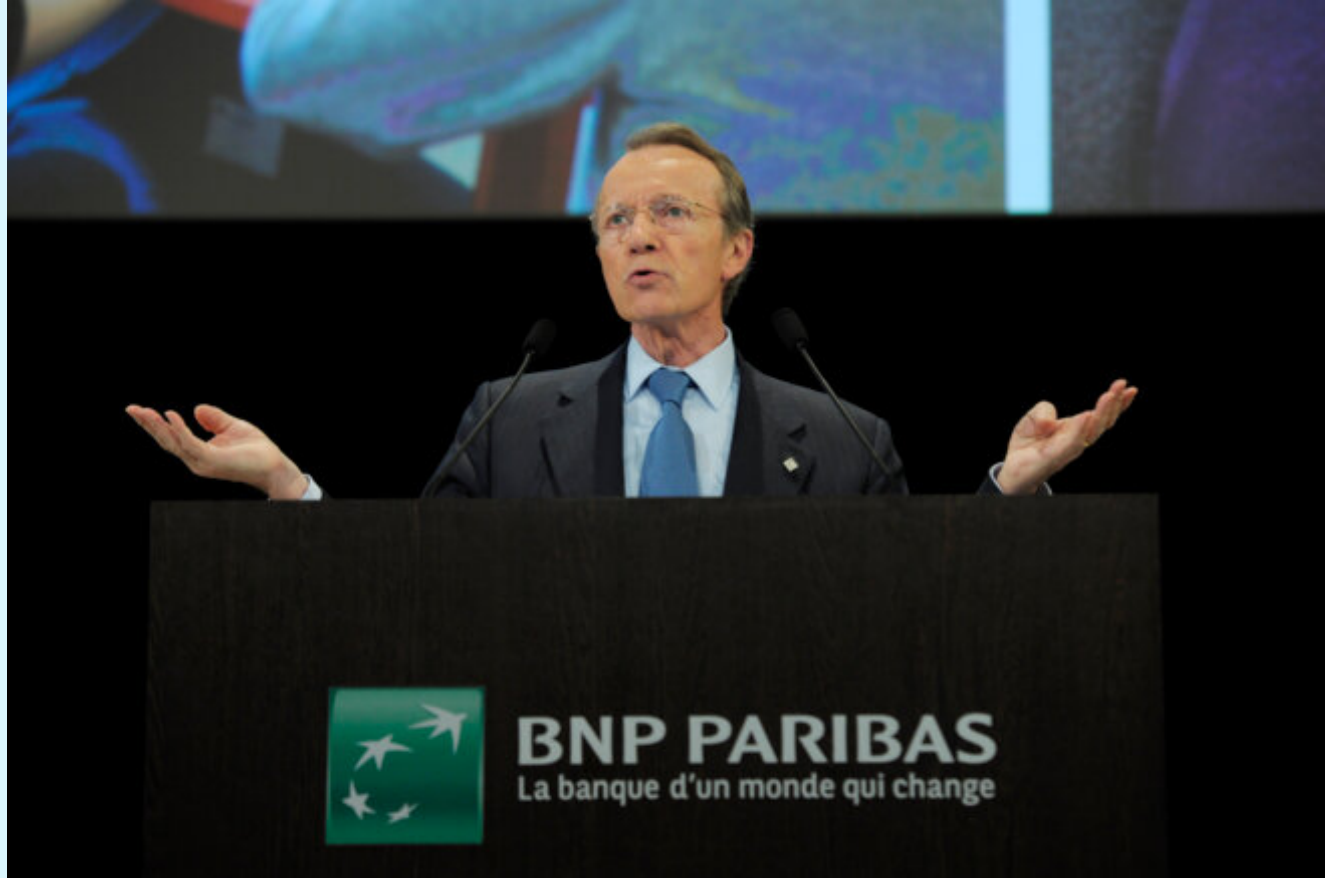
Michel Pébereau, président de BNP Paribas en 2011

Peut-on se passer de l'avis d'un homme aussi puissant qui dirige la quatrième banque mondiale, affichant un bilan de plus de 2 000 milliards d'euros, plus lourd que le PNB (produit national brut) de la France ? Certes, non. Mais le malaise suscité par cette image vient de ce qu'elle dit du rapport de force existant. Rarement image n'a autant résumé la capture du monde politique par le monde bancaire pendant la crise, ce « too big to fail » qui a pris tout le monde en otage et dicte ses solutions. Car ce sont bien les choix des responsables bancaires qui seront retenus, sans délibération démocratique, dans la gestion de la crise de 2008. Et c'est du président de BNP Paribas, que le pouvoir politique attend alors des remèdes.