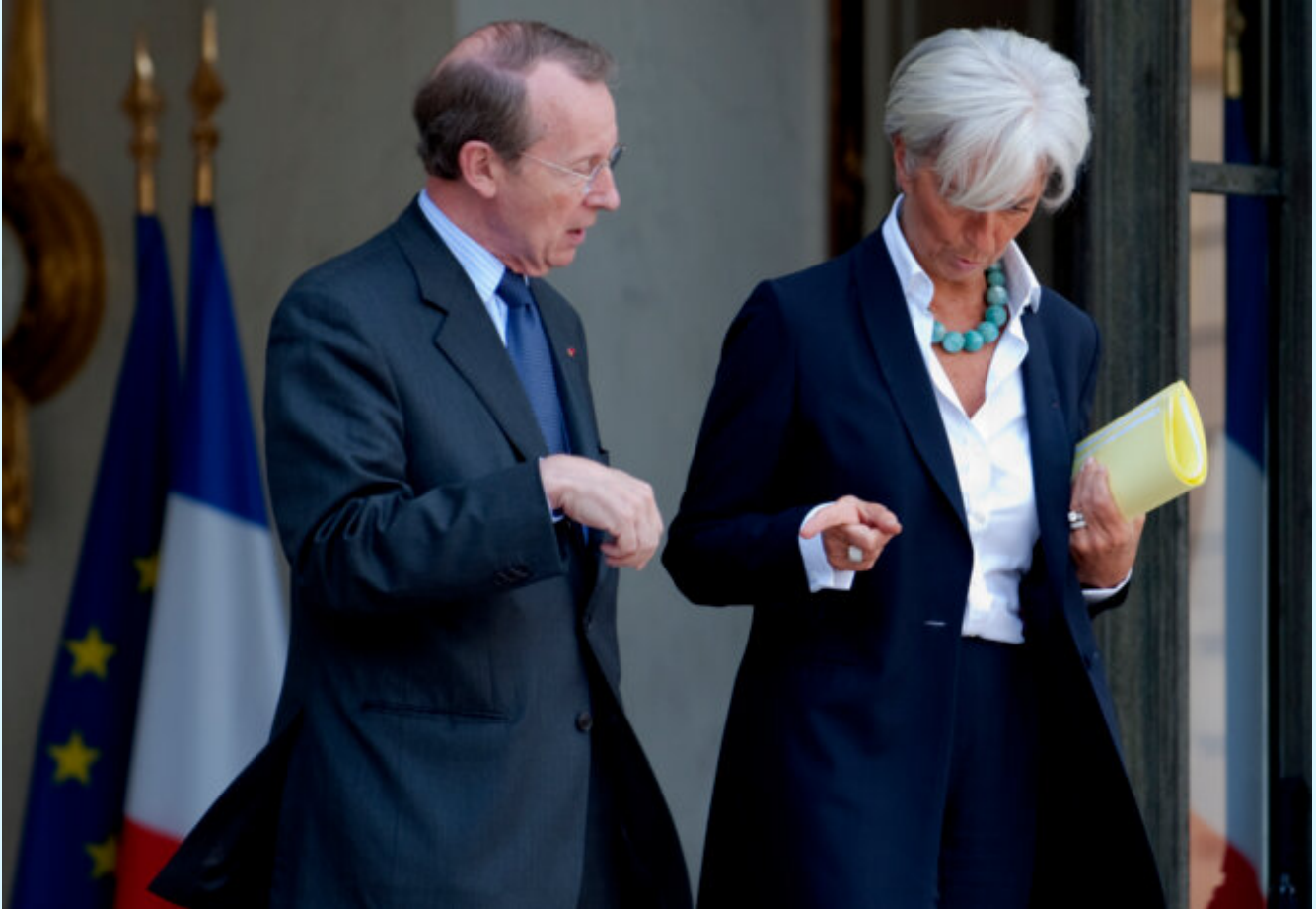
Michel Pébereau et Christine Lagarde, alors ministre des finances en octobre 2009

Que la caste de l'inspection des finances , monopolisant tous les postes dans les grandes banques, de la haute administration de Bercy et d'ailleurs, à la banque de France, et jusqu'à l'Élysée ait pesé sur toutes les décisions à cette période, cela ne se discute même pas. Elle a organisé l'impunité totale du monde bancaire. Elle a été à la manœuvre pour enterrer toutes les tentatives sérieuses d'encadrement, de régulation et de contrôle. Il en est allé de même pour la lutte contre l'évasion fiscale, les paradis fiscaux, la séparation des activités bancaires en France. Tout a été tourné au simulacre et à la parodie. En entendant Karine Berger, rapporteuse à l'Assemblée du projet de loi sur cette fameuse séparation des activités bancaires en 2013, raconter dans le documentaire que « les banquiers ont rédigé eux-mêmes la loi » - ce dont on se doutait -, on se prend à regretter son silence d'alors. Que n'a-t-elle pas parlé alors, plutôt que de cautionner par son mutisme cette caricature de réforme, qui allait emporter avec elle tous les projets européens de réforme bancaire ? ( lire ici , là ou encore là )