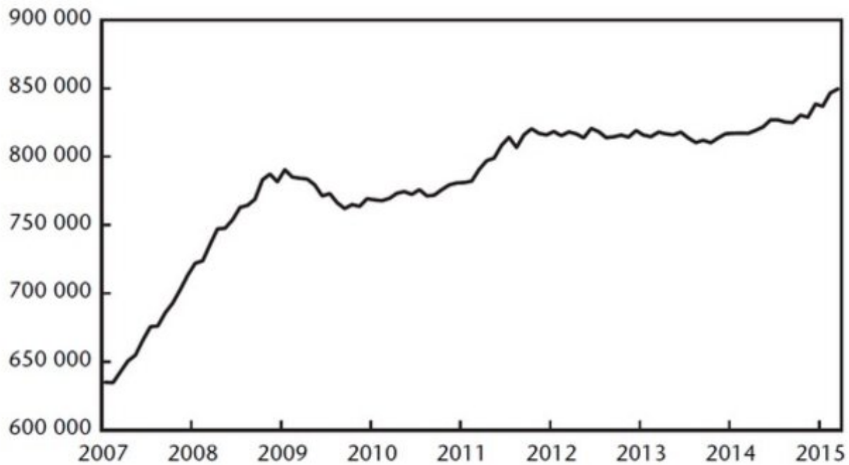
Graphique 1. Encours de crédits aux sociétés non financières en France En millions d'euros