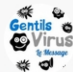
Les Gentils Virus